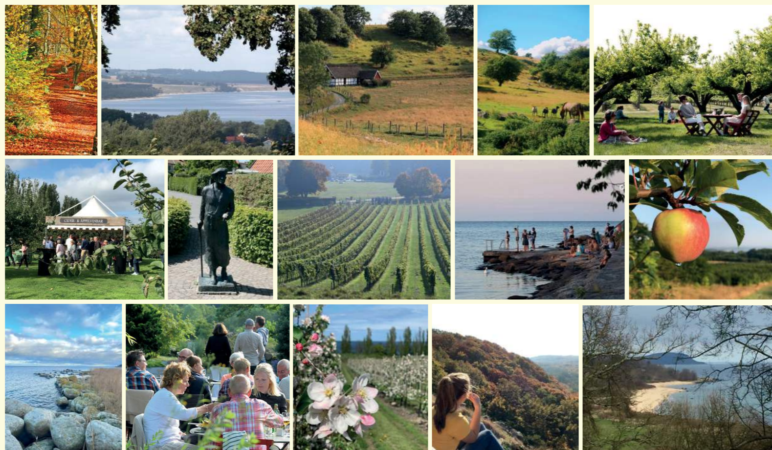
Alla bilder är tagna i de vackra, lokala omgivningarna runt Kivik.