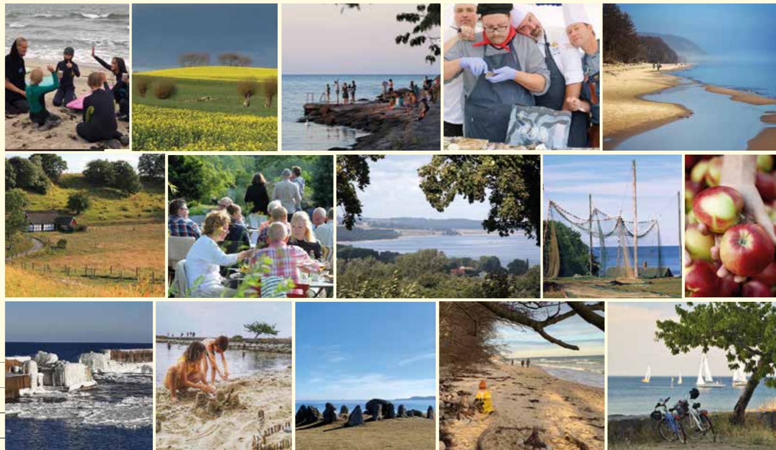
Flera av bilderna kommer från Kiviks Turisms fototävling på Instagram. Alla bilder är tagna i de vackra, lokala omgivningarna runt Kivik.