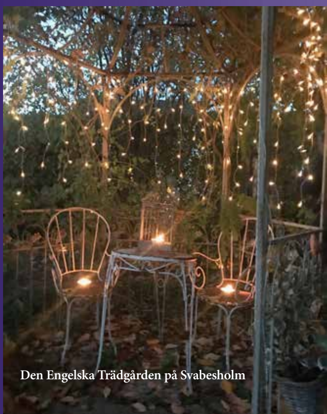
Den Engelska Trädgården på Svabesholm