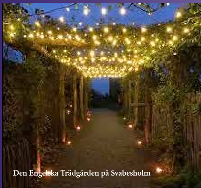
Den Engelska Trädgården på Svabesholm